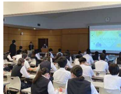
【プレゼン大会の様子】