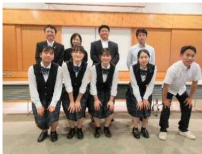
【お土産用菓子プレゼン大会 参加者の皆さん】