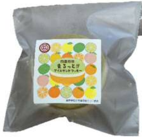
四国四県まるっと!!アイスサンドクッキー 430円(税込)