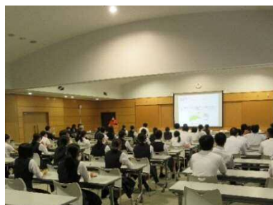
【うどん講座の様子】