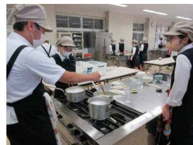
【讃岐うどん試食会の様子】