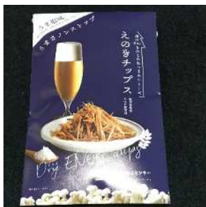
「えのきチップス」432円