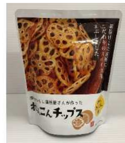
「れんこんチップス(からしれんこん味)」 324円