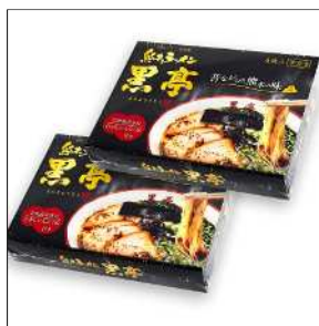
「黒亭ラーメン(4食入)」1,620円