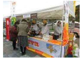
(画像はイメージです)

オープン当日の1日限りで、高知県、大豊町による地域物産ブースが出店されます。高速道路上ではこの日しか販売されない地域の物産のお買い物をお楽しみください。(令和3年9月18日(土曜)午前10時から午後4時まで予定)