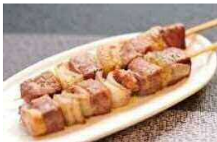
バーベキュー（1本 ¥450 [税込]）

さらに立川PAは「モテナス」ブランド店舗として、日常的にエリアをご利用いただくお客さまに対しても、「一店逸品メニュー」などの独自のサービスと真心のこもった「おもてなし」を提供します。