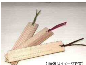
(画像はイメージです)

ご来場いただいたお客さまに、高知県産「スギ」材を使ったリニューアル記念「木のしおり」をプレゼント(先着100名様)