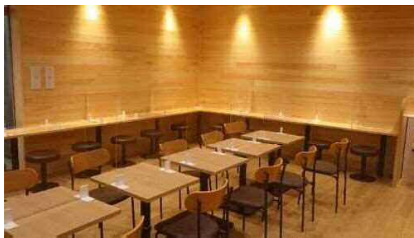
(高知県産木材の使用 (店内))