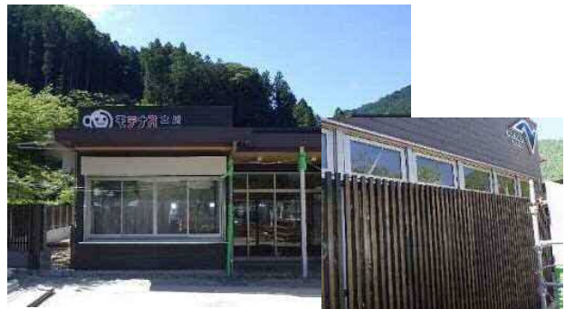
(周辺景観と調和した木目調の外観)