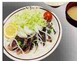
かつおのたたき定食（¥850 [税込]）