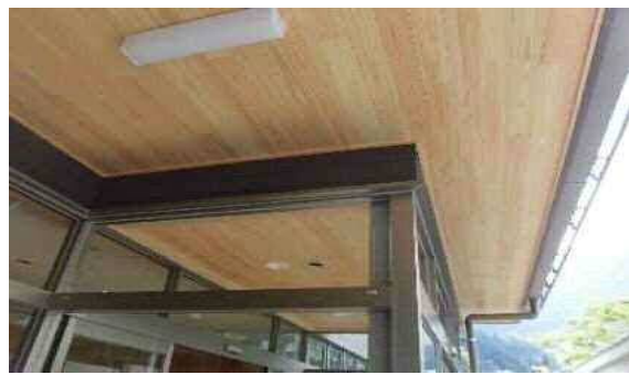
(高知県産木材の使用 (軒天))