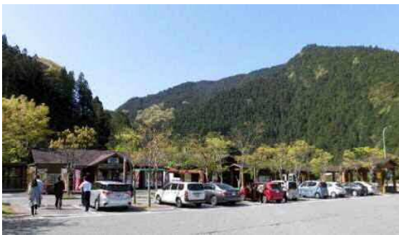
(高知県の豊かな森林が囲む周辺景観)

なお、店舗デザインは NEXCO およびグループ会社の若手技術者のコンペの結果、優れた作品からアイデアを一部採用したものであり、このように地域の木材を活用した店舗デザインはNEXCO西日本のサービスエリア・パーキングエリアにおいて初の試みとなります。