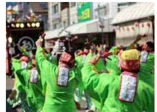
(画像はイメージです)

地元・大豊町のよさこいチーム「チームおとよ」の皆さまをお招きして、ご来店されたお客さまを演舞の披露でお出迎えします。(令和3年9月18日(土曜)2回公演予定)