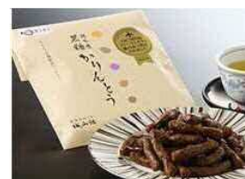
銀不老かりんとう（¥388 [税込]）