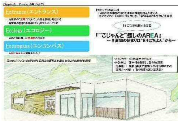
(NEXCO 若手技術者によるデザイン作成例)