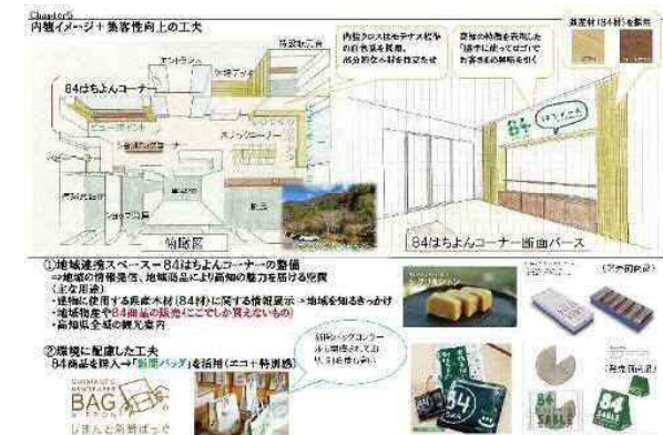
(NEXCO 若手技術者によるデザイン作成例 (内装))