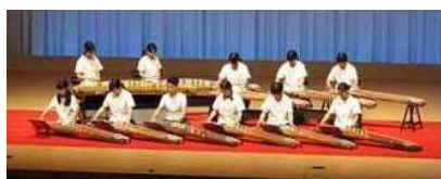
下関短期大学付属高校 箏曲部

全国高等学校総合文化祭日本音楽部門で出場経験のある 下関短期大学付属高校箏曲部の皆様をお招きして、 ご来店されたお客さまを「琴の音色」でお出迎えします。