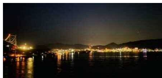
壇之浦PAから望む門司港レトロ帯のロマンチックな夜景