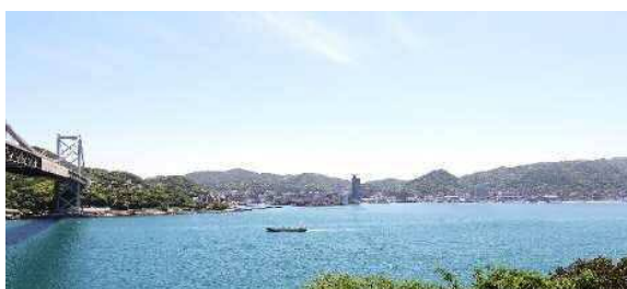
壇之浦PAから関門海峡を望む圧巻のロケーション