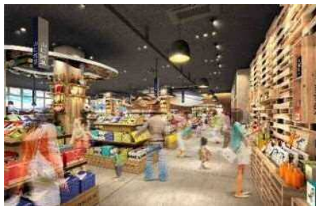
(画像はイメージです)