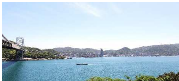
壇之浦PAから関門海峡を望む圧巻のロケーション