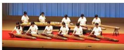
下関短期大学付属高校 箏曲部

全国高等学校総合文化祭日本音楽部門で出場経験のある 下関短期大学付属高校箏曲部の皆様をお招きして、 ご来店されたお客さまを「琴の音色」でお出迎えます。