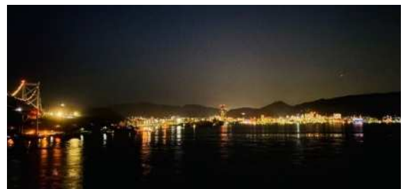
壇之浦PAから望む門司港レトロ帯のロマンチックな夜景