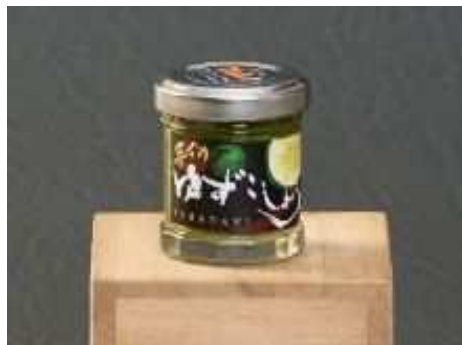
【されだにゆずこしょう】