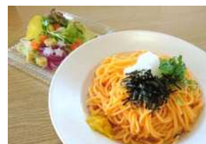
伊予灘サンセット～伊予農みかんうどん&星サラダ付～ (700円/食)