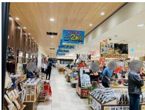
▲高松自動車道 豊浜SA(下り線)