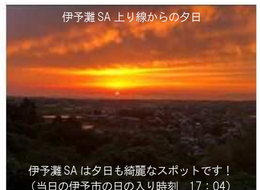
伊予灘 SA 上り線からの夕日

伊予灘 SA は夕日も綺麗なスポットです! (当日の伊予市の日の入り時刻 17:04)