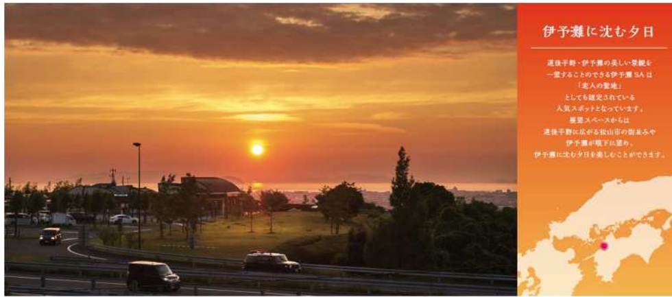
<伊予灘サービスエリア> 夕日が見られる時間