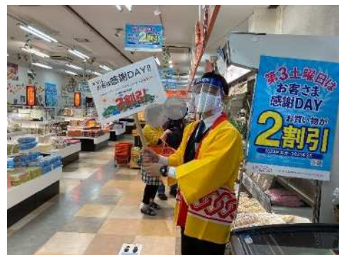
▲松山自動車道 石鎚山SA(下り線)