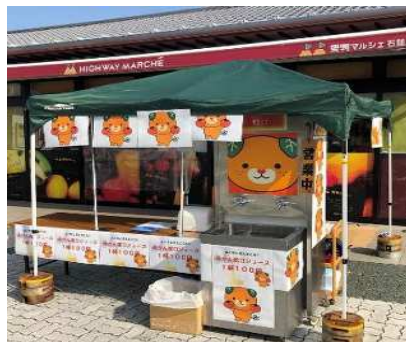
【みかん蛇口ジュース】