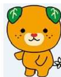
地元ゆるキャラ 中央:みきゃん