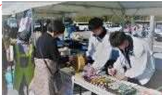
ガラポン抽選会 (イメージ)