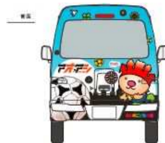
【えひめこどもの城×アオアシ×愛媛FC ラッピングカー】