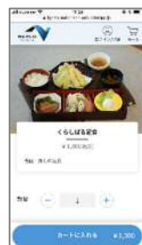
3. 数量を指定してご注文手続きへ