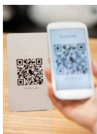
1. テーブル上のQRコードからサイトへアクセス