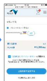
4. お客さま情報を入力（確定後、決済が完了します。）