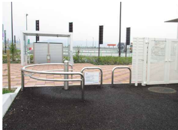
<ウェルカムゲート（イメージ）>

E10 宮崎自動車道 山之口SA（上下線） 《宮崎県都城市山之口町》 店舗営業者 宮交ショッピングアンドレストラン株式会社