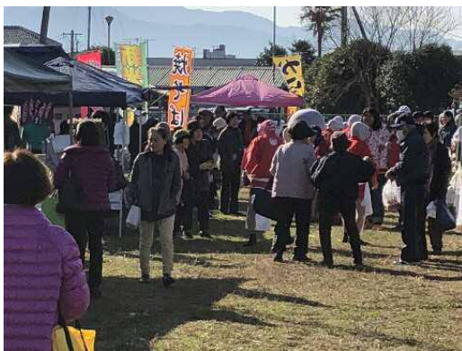
地元商品の販売（イメージ）