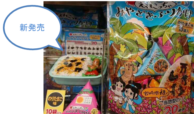
<みやざき・えれこっちゃん・ふりかけ 650円>