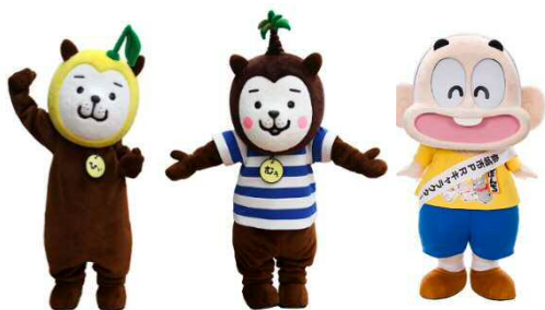
みやざき犬 （左：ひいくん、右：むうちゃん）