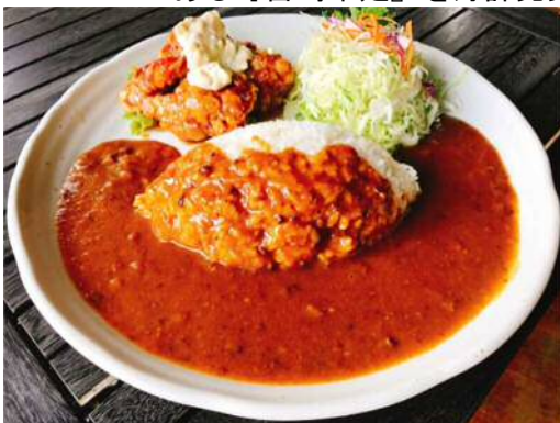
<チキン南蛮カレー1,000円(税込)>

都城市の人気カレー店「カレー倶楽部ルウ」の『チキン南蛮カレー』や山之口SAオリジナルメニューである『宮崎辛麺』を好評発売中。