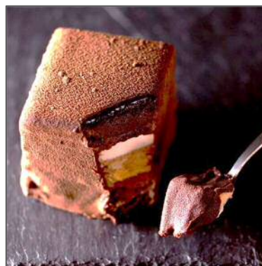
<石畳シヨコラ (1箱) 1,200円(税込)>