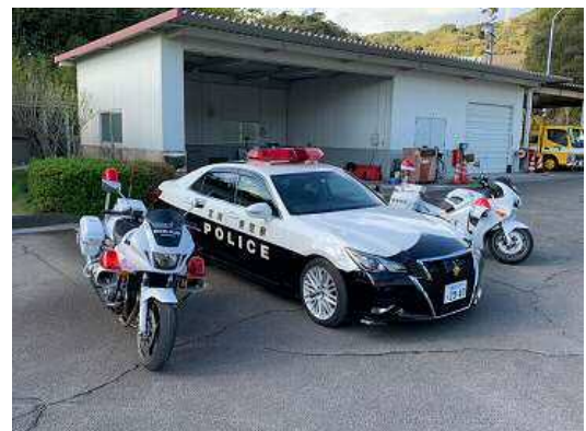
パトロールカー・白バイ展示（イメージ）