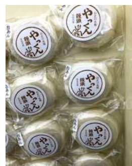
やっくん饅頭 150円（税