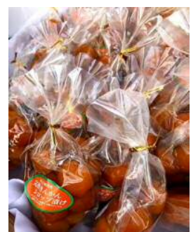
完熟きんかんシロップ漬け 330円（税込）