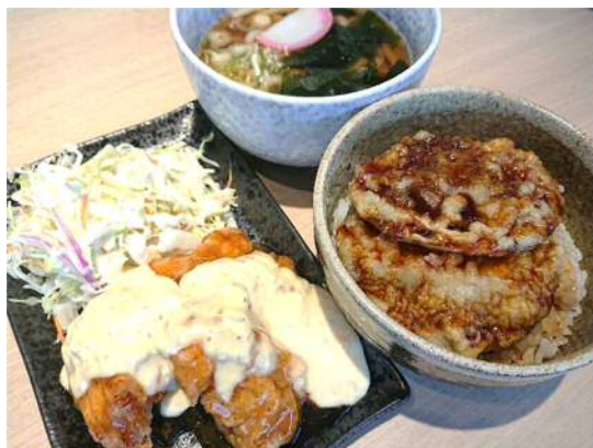
<山之口定食 900円(税込) 1/18、1/19 限定>

1/18、1/19の2日間限定で通常価格より80円引きの900円(税込)で提供します。