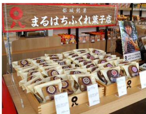
<ふくれ菓子 1カット 180円(税込)>

また、南男猿をモチーフにしたキャンディ『南男猿飴』や、宮崎名物などをご当地の形にカットした海苔が入ったふりかけ『みやざき・えれこっちゃん・ふりかけ』など、宮崎県にちなんだ商品を新たに導入します。