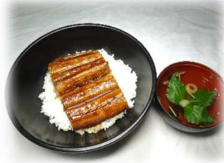
「四万十鰻丼」2,480 円(税込)

創業以来 40 年間、「おいしい」は当然、消費者に「安心・安全」であることを実現した高知県産四万十鰻を養殖している、四万十うなぎ株式会社。すっきりとした旨味のある脂、噛めば噛むほど旨味を感じる鰻をご飯とともに楽しみいただけます。