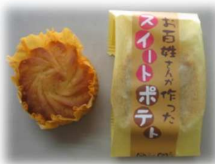
「お百姓さんが作ったスイートポテト」 140 円(税込)

徳島県産の「鳴門金時」をたっぷり使用。上品な甘み、しっとりとした食感のバランスが絶妙で、後味はさっぱりいただける逸品です。芋の栽培からお菓子への加工まで一に行い、「こだわり」や「安全性」も感じられる商品をお客さまにお楽しみいただくため、サービスエリアでの販売を開始しました。