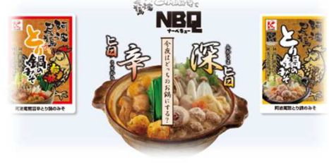
「阿波尾鶏とり鍋のみそ」