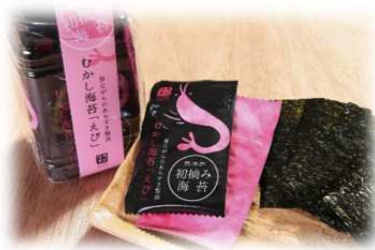
「むかし海苔 えび」1,080円(税込)