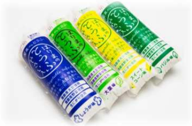
「はりまのとうふ やさい入 (バジル・生姜・スイートコーン・大葉)」各 406円 (税込)

1910年(明治43年)揖保川沿いにて創業し、以来100年以上、豆腐を作り続けてきた「真心とうふ 武内食品株式会社」。しっかりと大豆の味がする豆腐に、野菜の風味や甘みが溶け込み、お口の中にまるやかな味わいが広がります。