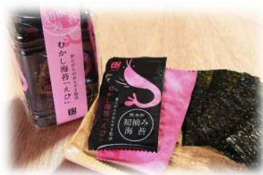
「むかし海苔 えび」1,080円(税込)