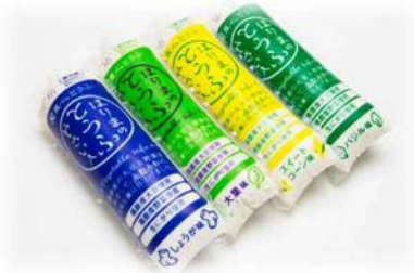
「はりまのとうふ やさい入 (バジル・生姜・スイートコーン・大葉)」各406円(税込)

1910年(明治43年)揖保川沿いにて創業し、以来100年以上、豆腐を作り続けてきた「真心とうふ 武内食品株式会社」。しっかりと大豆の味がする豆腐に、野菜の風味や甘みが溶け込み、お口の中にまるやかな味わいが広がります。