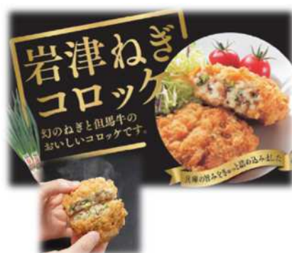
「岩津ねぎコロッケ」230円

日本三大ねぎの『岩津ねぎ』、和牛の最高峰『但馬牛』、甘さ際立つ『淡路島産玉ねぎ』をふんだんに使用した贅沢なコロッケです。ぜひご賞味ください。