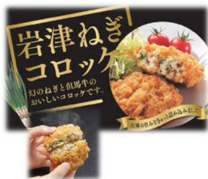
「岩津ねぎコロッケ」230円