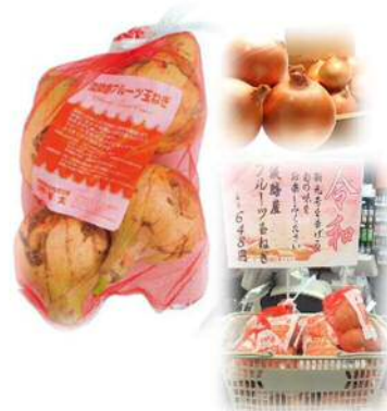
「淡路島フルーツたまねぎ」648円

姫路に本店を構える「江戸屋 和 (なごみ)」の人気商品。大福とプリン of 意外な組み合わせは、発売から30年経った今でも幅広い世代に愛されています。