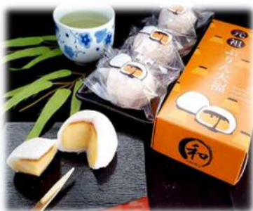
「元祖プリン大福 (1個) 320円 (3個) 960円