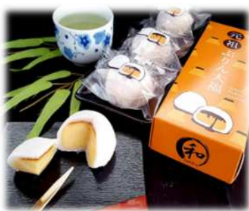
「元祖プリン大福 (1個) 320円 (3個) 960円

姫路に本店を構える「江戸屋 和(なごみ)」の人気商品。大福とプリンの意外な組み合わせは、発売から30年経った今でも幅広い世代に愛されています。