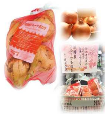
「淡路島フルーツたまねぎ」648円

高級有機肥料を使用し、より甘さを追求した淡路島フルーツたまねぎ。加熱するとさらに甘さとコクが増す逸品で、フライや炒め物など様々な料理にご利用いただけます。