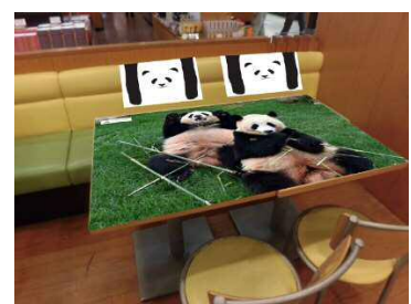
パンダシートイメージ