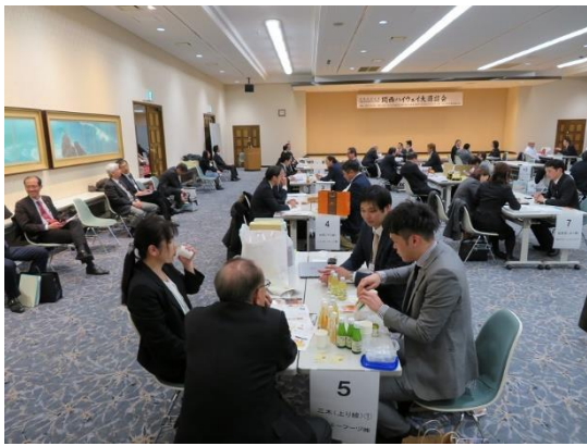
対面形式による商談会