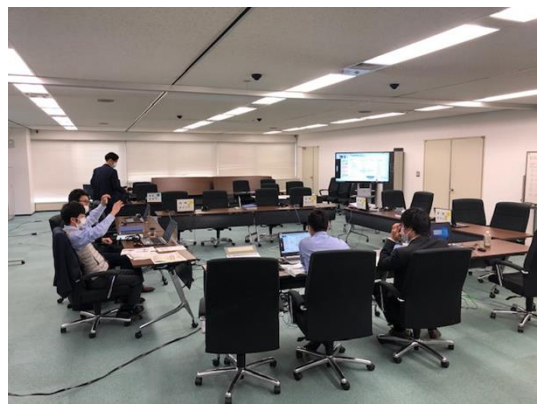
オンラインによる商談