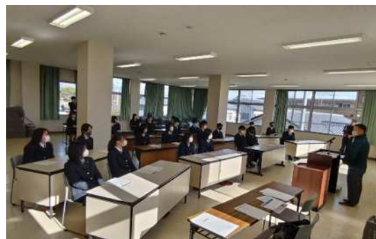
吉野川高等学校での授業風景