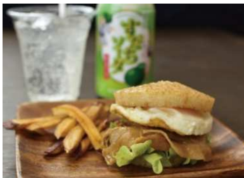
上板 SA(上下線)で販売の 吉野川高等学校考案メニュー