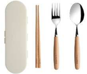
（カトラリーセット）