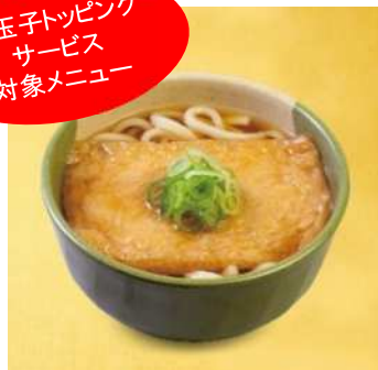
《きつねうどん 税込 490 円》