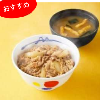
《牛めし 税込 380 円》