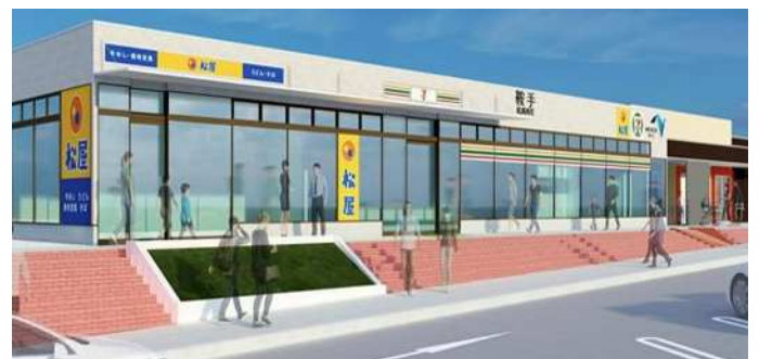
《鞍手PA(外観イメージ)》