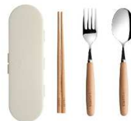
（カトラリーセット）