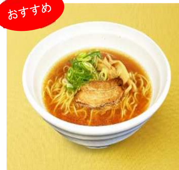
《醤油ラーメン 税込 690 円》

※リニューアルオープンサービスは新型コロナウイルス感染症拡大の影響により、変更となる場合がございますので、 あらかじめご了承ください。