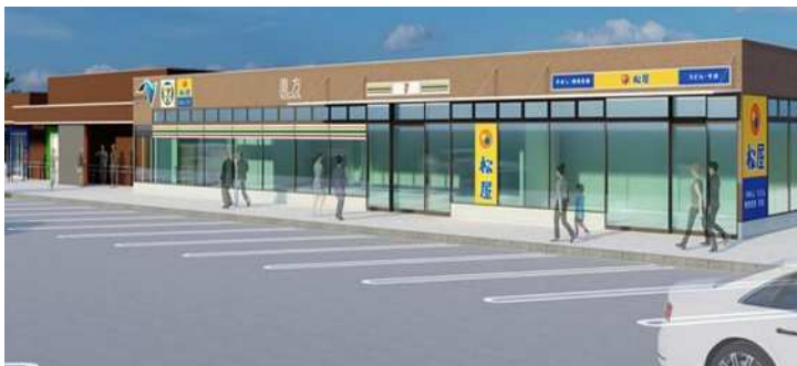
《直方PA(外観イメージ)》

なお、店舗切替作業に伴い営業休止(約3日間)させていただきます。営業休止期間におきましては、近隣のサービスエリア(SA)・パーキングエリア(PA)をご利用いただきますようお願いいたします。お客さまにはご不便をおかけしますが、ご理解と協力をお願いします。