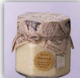
「姫路アーモンドバター」