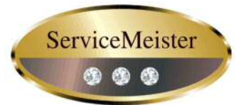
グランプリ受賞者に贈呈する 接客マイスター認定バッジ

1. 開催目的 NEXCO西日本管内の 183 箇所のSA・PA各店舗では、約 8000 名の接客スタッフが在籍しています。本大会は、接客スタッフの日頃の業務を西日本全体で披露する機会として、接客スタッフ一人ひとりのモチベーションアップを図り、全社的な接客スキルのレベルアップに繋げることを目的として、平成 23 年度より開催しています。