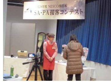
前回(平成28年度)の接客コンテストの様子