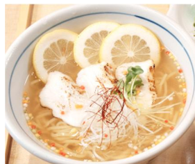
「愛媛鯛塩ラーメン」