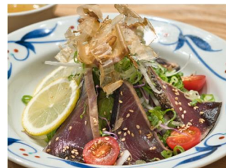
「明神丸かつおのタタキ」