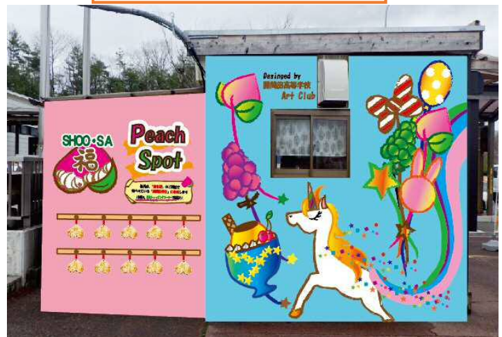
フォトジェニックスポット イメージ

絵馬の裏には願い事を書いていただくこともでき、スポットに掛けて頂いた絵馬は、「勝負運」でご利益のある神社として地元から親しまれている「勝間田神社」に奉納させていただきます。