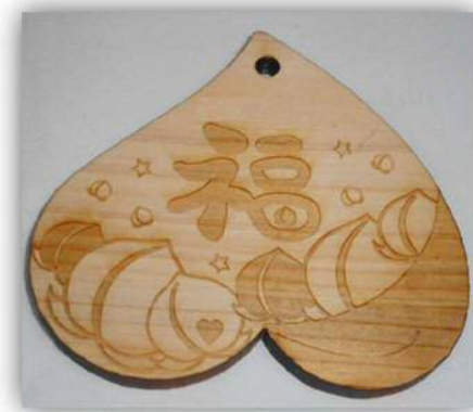
桃型の絵馬イメージ

岡山県立勝間田高等学校の生徒さまによるスポットの除幕を行います。 除幕式の後、生徒さまからスポット説明を行って頂き、スポットに「桃型 の絵馬」を飾り付けていただきます。