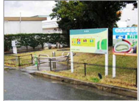
ウェルカムゲートのイメージ(金立SA)