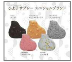
ODOUX D'AMOUR (ドウ・ダムール)

オーストリア菓子職人の最高のパフォーマンスから生まれました。サクサクとした食感にバターの風味が香るサブレーはそのままに、ストロベリー、チェリー、キャラメルオレンジ、ブラックセサミ、ピスタチオの5種類のフレーバーをトッピングした逸品です。