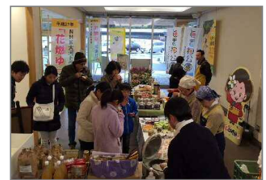
多目的スペースのイメージ(美東SA)