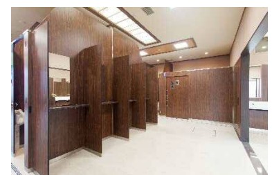
パウダールームのイメージ(美東SA)

(サブトイレ) 男性用) [小]:6基、[大]:6基 女性用) 16基 多目的) 1基