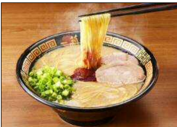
(天然とんこつラーメン専門店「一蘭」のラーメン)