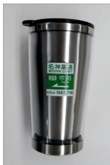
商品名:ステンスタンプラー 販売価格:¥1,160-