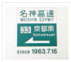
商品名:メモ帳 販売価格:¥370-