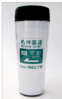
商品名:デザインタンブラー 販売価格:¥1,250-