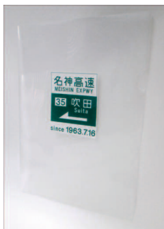
商品名:クリアファイル 販売価格:¥500-(3枚セット)