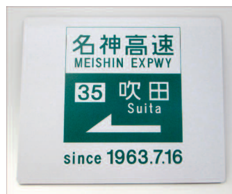
商品名:マウスパッド 販売価格:¥420-