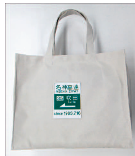
商品名:スクエアバッグ 販売価格:¥920-